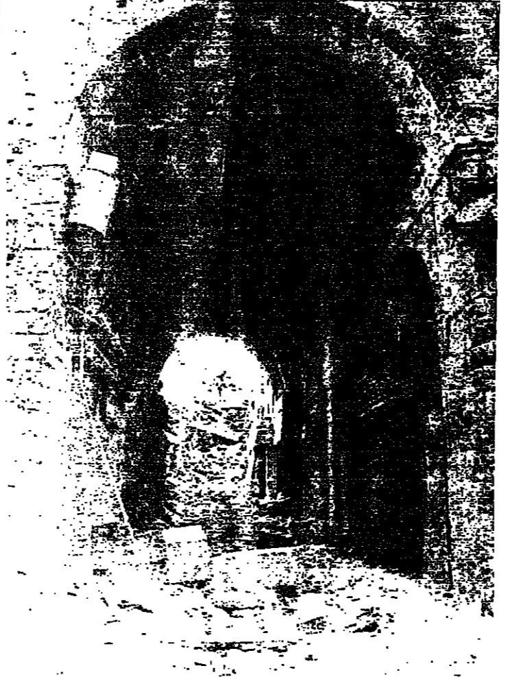
أحد أندية السوق البلديّة

وقد واجه المعهد الصناعي منذ ان بدأ انشطته مشكلة مالية، لانه وان اشرف في الأصل باعمال عامة لبيانية - امريكية، أما روعي في سياسته، كما يطمح مجلس ادارته، ان يبيع ذا كفاءه ذاتي، بحيث تغطي نفقاته وارداته من بدلات الخدمات التي يقدمها لزيائته من مؤسسات خاصة أو ادارات عامة.